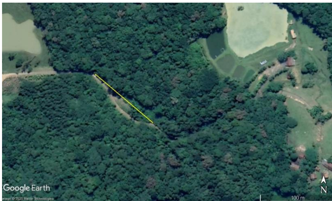
Figura 4. Croqui de localização de trecho sem o cabo “neutro” (linha amarela). Coordenada inicial: Latitude: 26°45'20.40"S; Longitude: 49° 1'22.64"O

A Figura 5 indica o local que necessita ser trocado um poste que quebrou no ciclone bomba de 30 de junho deste ano. O Poste foi amarrado em uma estaca (Figura 6 e continua lá até hoje. Gradativamente o mesmo está inclinando e corre risco de queda em estrada.