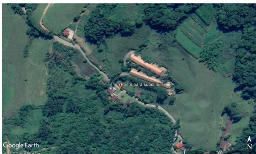
Figura 5. Croqui de localização de poste que necessita ser substituído. Localização do poste: Latitude: 26°45'42,50"S;

A Figura 5 indica o local que necessita ser trocado um poste que quebrou no ciclone bomba de 30 de junho deste ano. O Poste foi amarrado em uma estaca (Figura 6 e continua lá até hoje. Gradativamente o mesmo está inclinando e corre risco de queda em estrada.