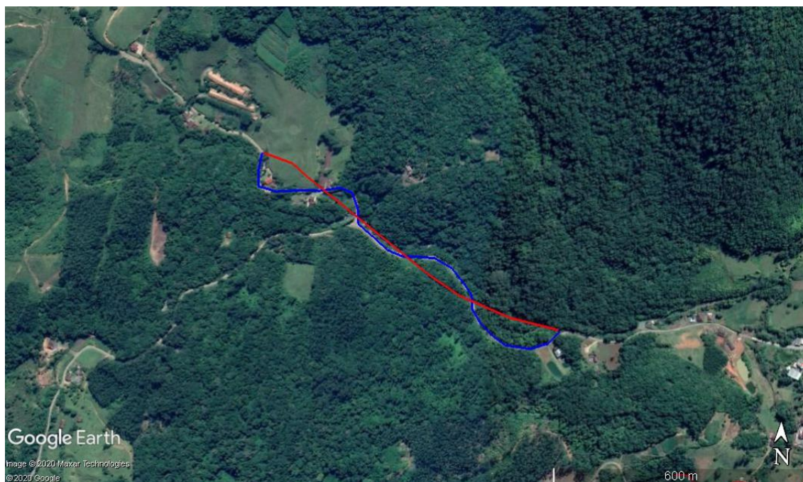
Figura 3. Croqui de localização de rede atual que necessita ser substituída (linha vermelha) e indicação do novo traçado da rede (linha azul).

Coordenada inicial das linhas: Latitude: 26°45'57.32"S; Longitude: 48°59'35.24"O