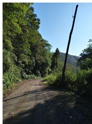
Figura 8. Poste com elevado grau de inclinação que necessita de manutenção.

Justificativa: Considerando as melhorias acima mencionadas, necessário se faz o presente requerimento.