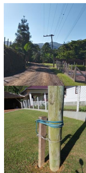
Figura 6. Detalhes do poste inclinado e do reparo