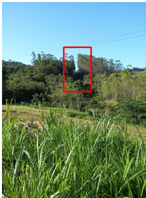
Figura 2. Detalhes do trecho da rede de transmissão que atravessa área de vegetação nativa e plantios.

O trecho da Figura 3 indica o atual traçado da rede que também corta a vegetação nativa da região. Neste trecho há necessidade de implantar o novo traçado na margem da estrada, conforme indicado na Figura 3.