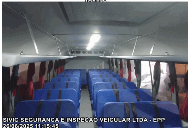
INTERIOR DO VEÍCULO, RETIRADA DA PARTE FRONTAL PARA A PARTE TRASEIRA

SIVIC SEGURANCA E INSPECAO VEICULAR LTDA - EPP 26/06/2025 11:15:45