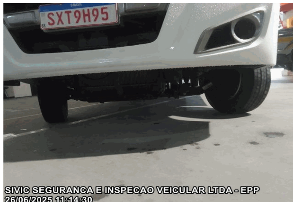
EIXO E PNEUS DIANTEIROS DO VEÍCULO

SIVIC SEGURANCA E INSPECAO VEICULAR LTDA - EPP 26/06/2025 11:14:30