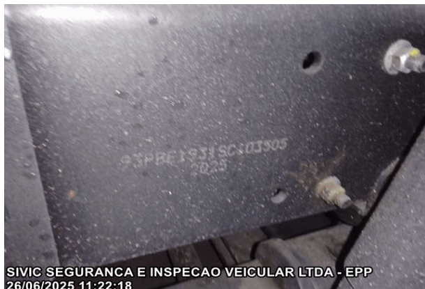
NUMERAÇÃO DO CHASSI

SIVIC SEGURANCA E INSPECAO VEICULAR LTDA - EPP 26/06/2025 11:22:18