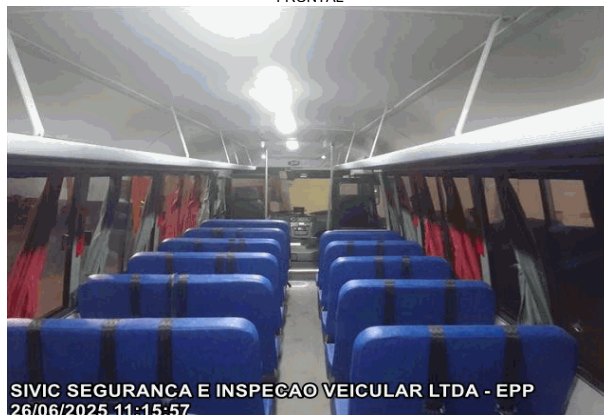
INTERIOR DO VEÍCULO, RETIRADA DA PARTE TRASEIRA PARA A PARTE FRONTAL

SIVIC SEGURANCA E INSPECAO VEICULAR LTDA - EPP 26/06/2025 11:15:57