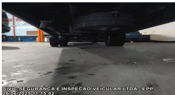
EIXO E PNEUS TRASEIROS DO VEÍCULO

SIVIC SEGURANCA E INSPECAO VEICULAR LTDA - EPP 26/06/2025 11:15:02