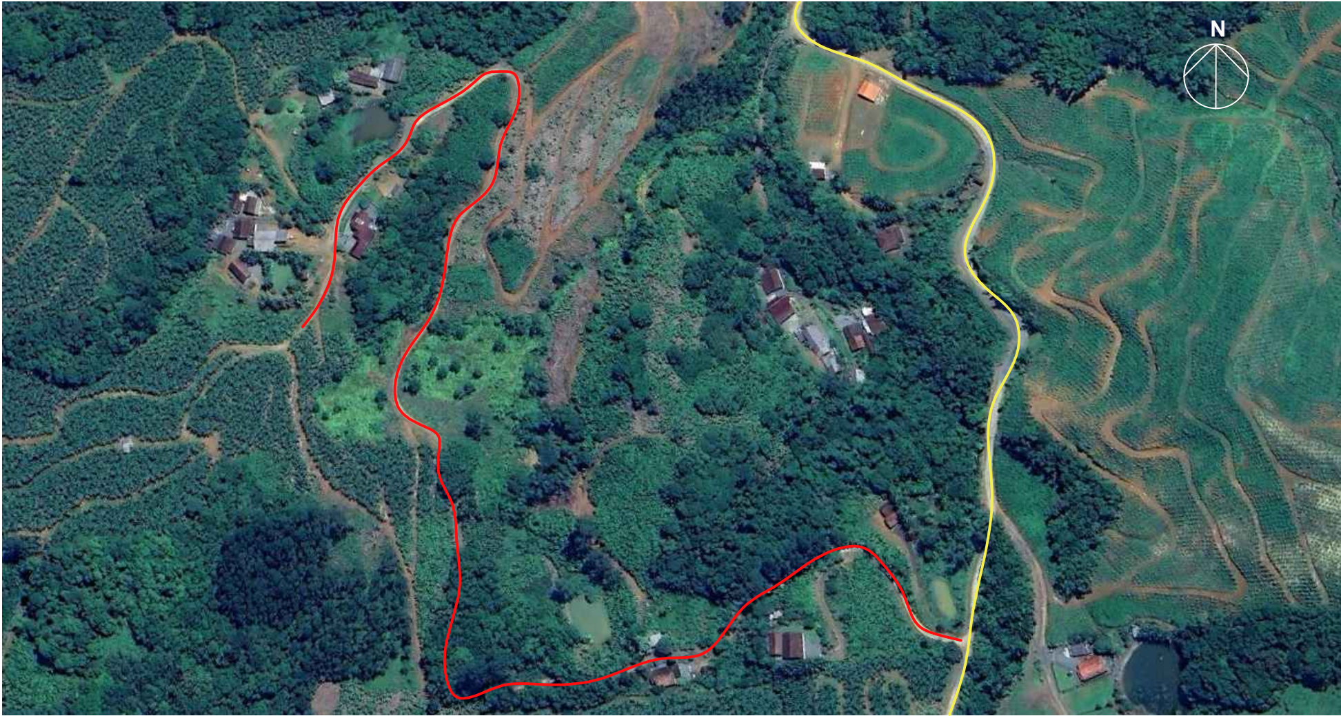
— ESTRADA GERAL DO BRAÇO JOAQUIM — RUA WALDIR ALTINI